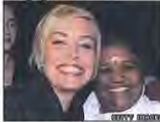
Stone said Amritanandamayi was a "remarkable angel"

Actress Sharon Stone has presented India's famous female guru, Mata Amritanandamayi, with an award for her humanitarian work.