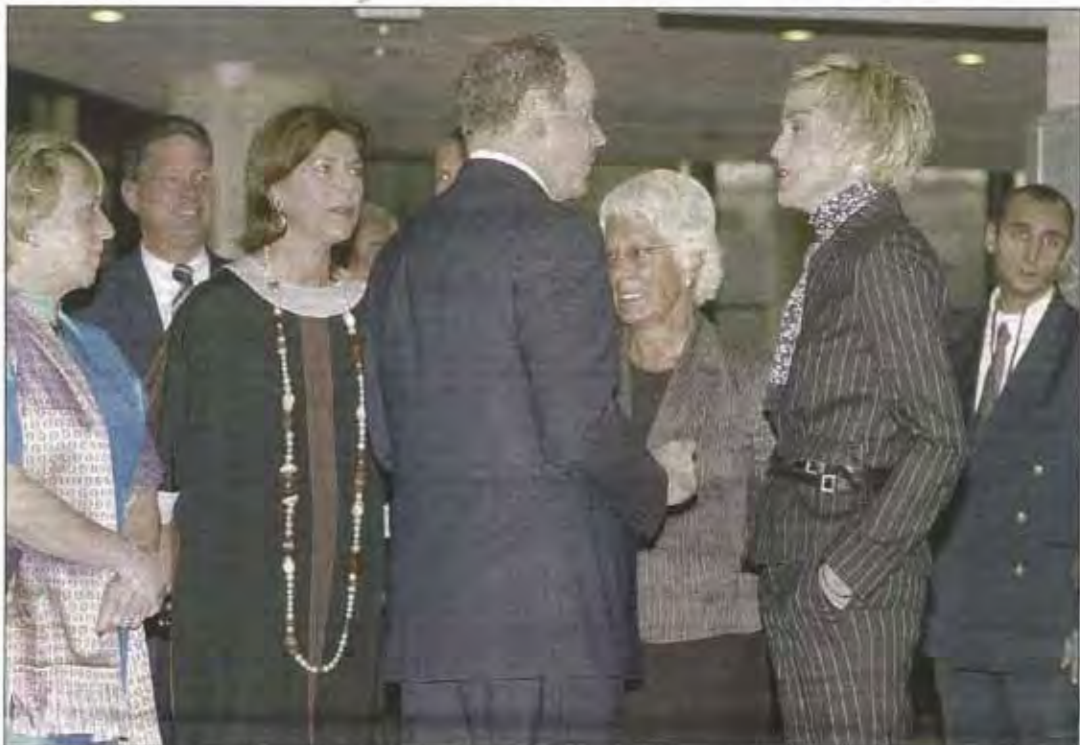
Lors de l'inauguration du festival Sharon Stone s'entretient avec le prince Albert II et la princesse Caroline.

Dès lors l'a-t-on vue à l'auditorium Rainier III aux côtés du prince souverain Albert II et de la princesse Caroline. Mais surtout l'a-t-on (trop brièvement,