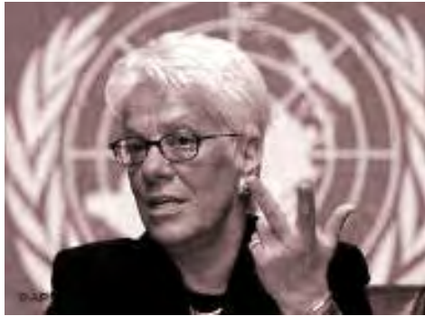
Chief UN War Crimes Prosecutor Carla Del Ponte of Switzerland is seen during a press conference for the "International Rendez Vous Cinema Verite"