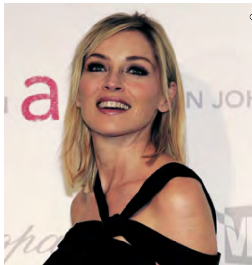
L'attrice Sharon Stone