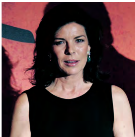
La principessa Carolina di Monaco

Il festival Cinema Verità si svolge per le prime due giornate nel Principato di Monaco, per poi proseguire a Parigi, dal 12 al 14 ottobre, con la proiezione di ben 50 film seguiti da dibattiti ed incontri con gli autori. La nascita di questa rassegna cinematografica era stata annunciata durante l'ultimo festival di Cannes, nel maggio scorso, dalla regina Noor di Giordania, vedova del re Hussein, che fa parte del comitato d'onore del Cinema Verità. In quell'occasione la regina Noor ne aveva riassunto lo spirito con queste parole: «Ho visto il meglio ed il peggio dell'impatto che i film hanno nel mondo, ho visto il cinema e i media essere usati per promuovere l'odio e la violenza. Mentre invece ci sono film, a cominciare da "Indovina chi viene a cena" (di Stanley Kramer) fino al più