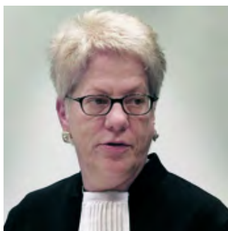
Carla Del Ponte