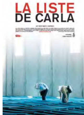
La liste de Carla plonge dans les coulisses du TPI.

Pour plus d'information : www.cinema-verite.org