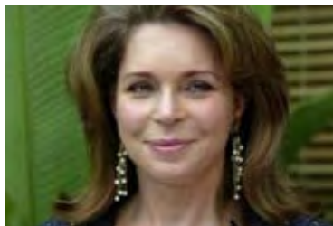
La reina Noor de Jordania alaba el cine comprometido

Copyright © 2007 AFP. Todos los derechos reservados. Copyright © 2007 Yahoo! Todos los derechos reservados