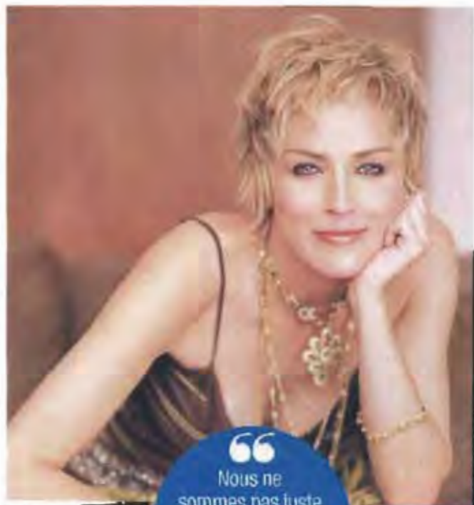
Une femme de convictions.