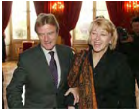
Interdiction des mines anti-personnel: entretien de Bernard Kouchner avec Mme Jody Williams à l'occasion des Rencontres Internationales Cinéma Vérité