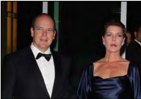
Prince Albert II of Monaco and his sister Princess Caroline of Hanover arrive for a gala dinner to benefit the Cinema Verite fund, Wednesday, Oct. 10, 2007, during the "International Rendez Vous Cinema verite" meeting, in Monaco. The Cinema Verite fund is an investment fund enabling financial support for the production of films with an humanitarian and socially conscious message.