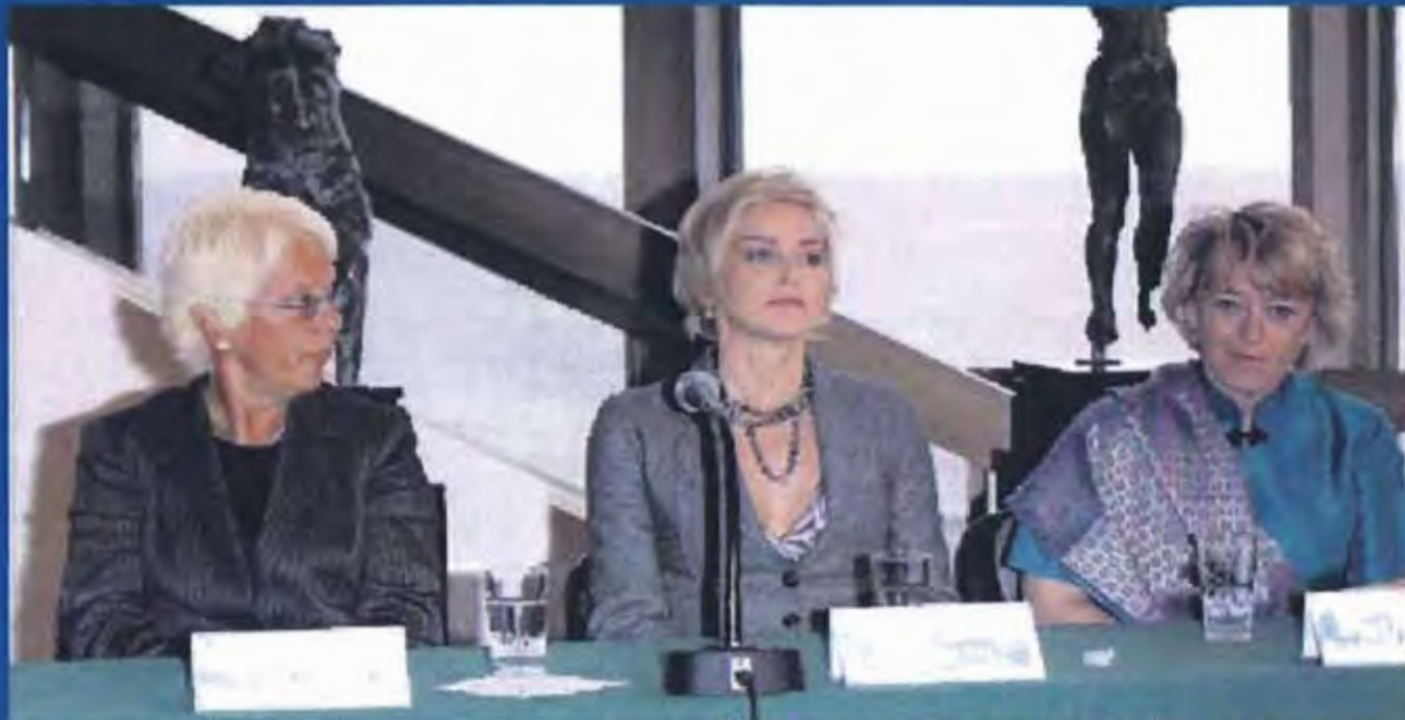
Avec la procureur du Tribunal international pour l'ex-Yougoslavie, Carla Del Ponte, et Jody Williams, prix Nobel de la paix 1997, à Monaco, mercredi.

“ Vous, citoyens du monde, vous, forces majeures, vous êtes responsables, vous devez être dignes et agir ! ”