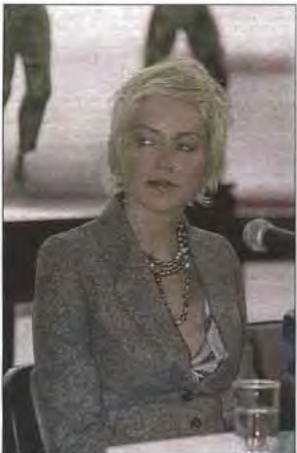
Sharon Stone, le regard toujours envoûtant, suscite autant d'applaudissements qu'elle déchaîne la bousculade chez les photographes.